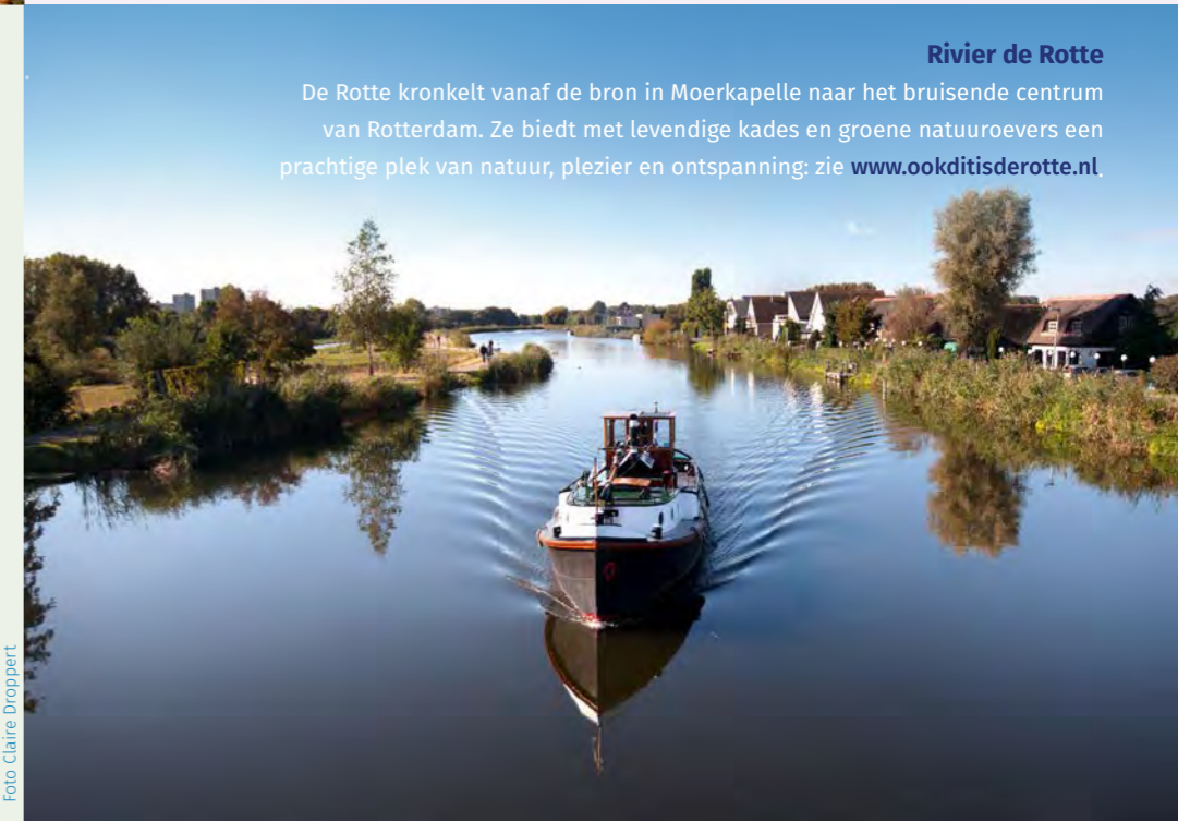
Rivier de Rotte De Rotte kronkelt vanaf de bron in Moerkapelle naar het bruisende centrum van Rotterdam. Ze biedt met levendige kades en groene natuuroevers een prachtige plek van natuur, plezier en ontspanning; zie www.ookditisderotte.nl