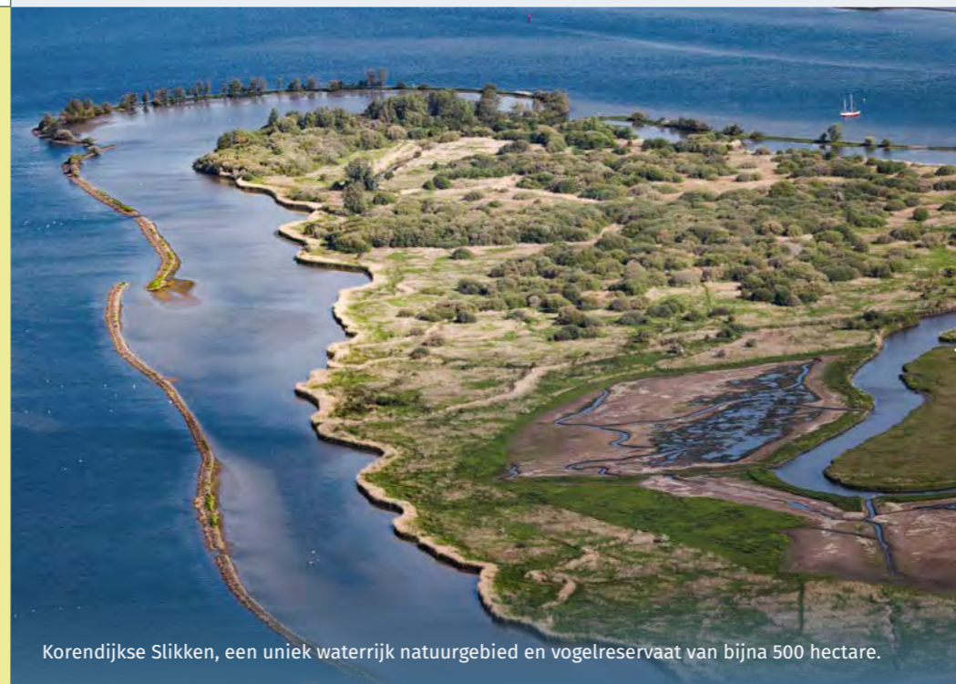
Korendijkse Slikken, een uniek waterrijk natuurgebied en vogelreservaat van bijna 500 hectare.