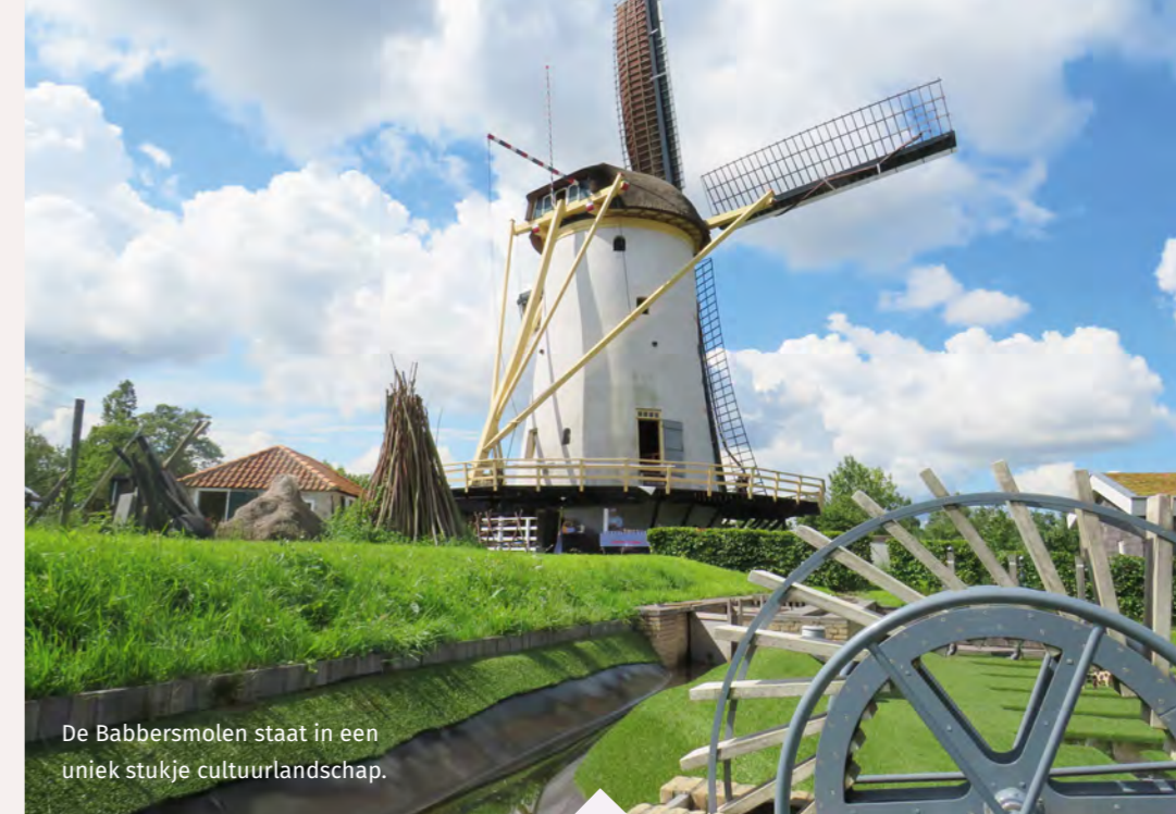
De Babbersmolen staat in een uniek stukje cultuurlandschap.