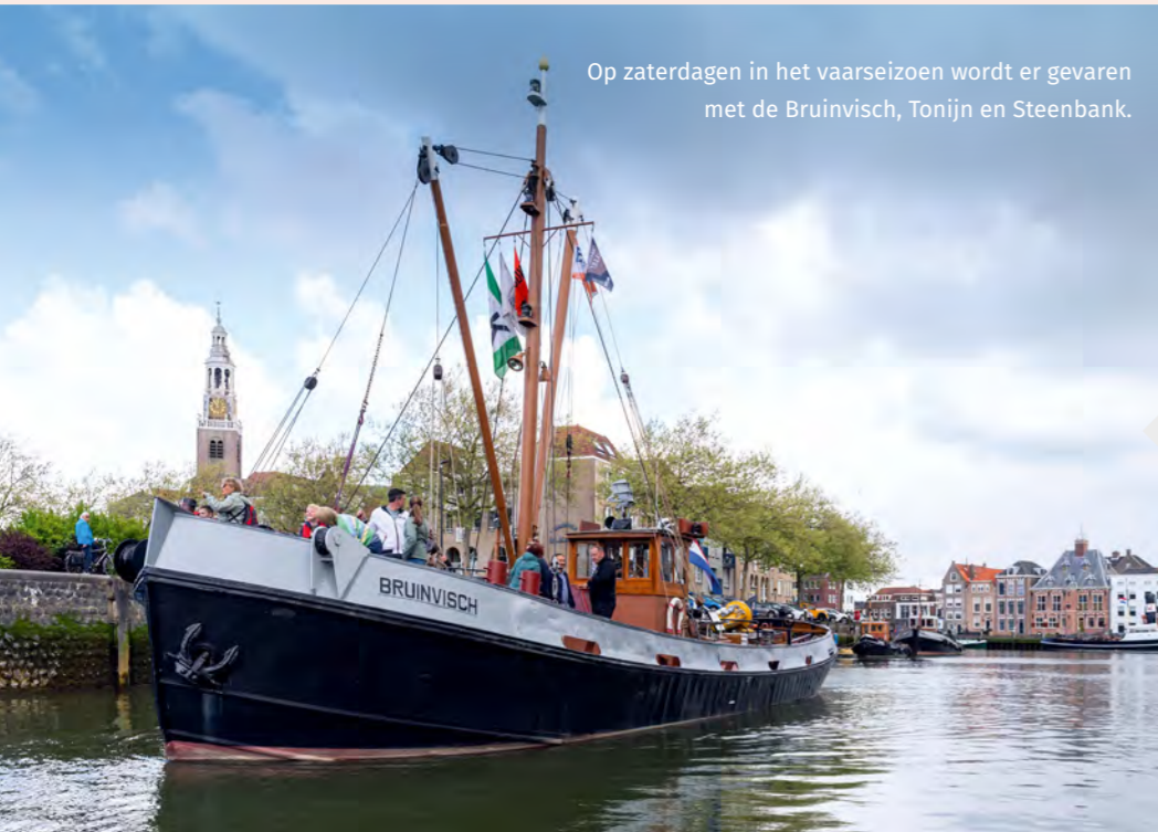
Op zaterdagen in het vaarseizoen wordt er gevaren met de Bruinvisch, Tonijn en Steenbank.