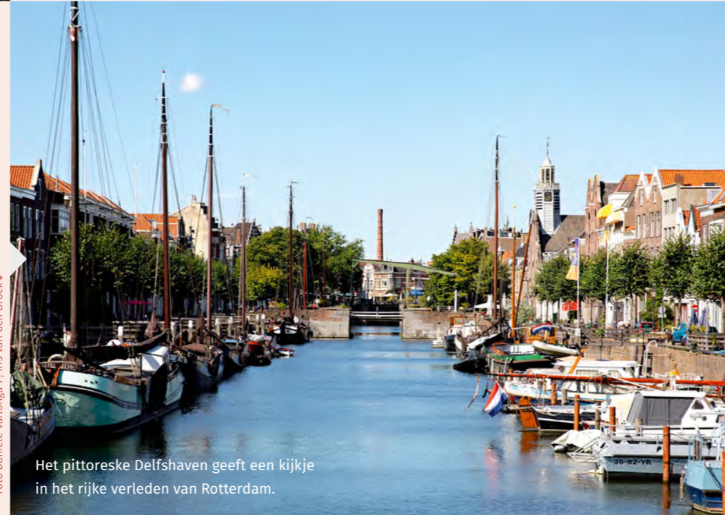
Het pittoreske Delfshaven geeft een kijkje in het rijke verleden van Rotterdam.