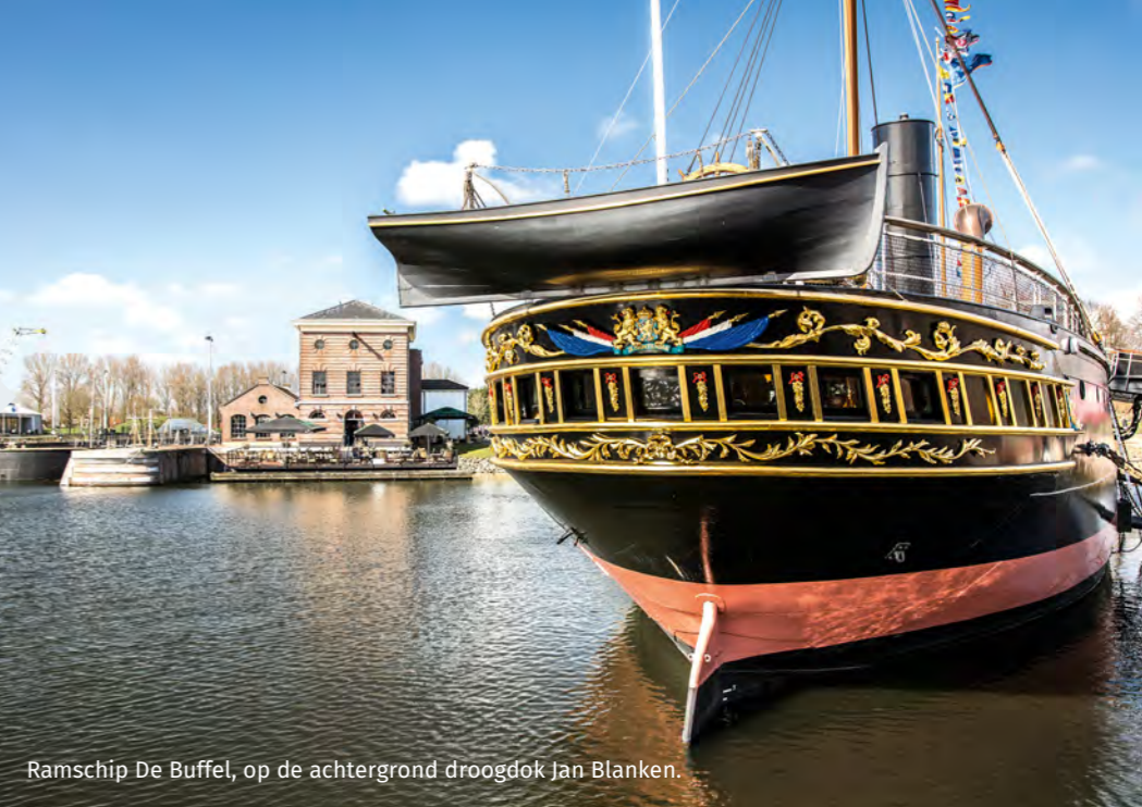
Ramschip De Buffel, op de achtergrond droogdok Jan Blanken.